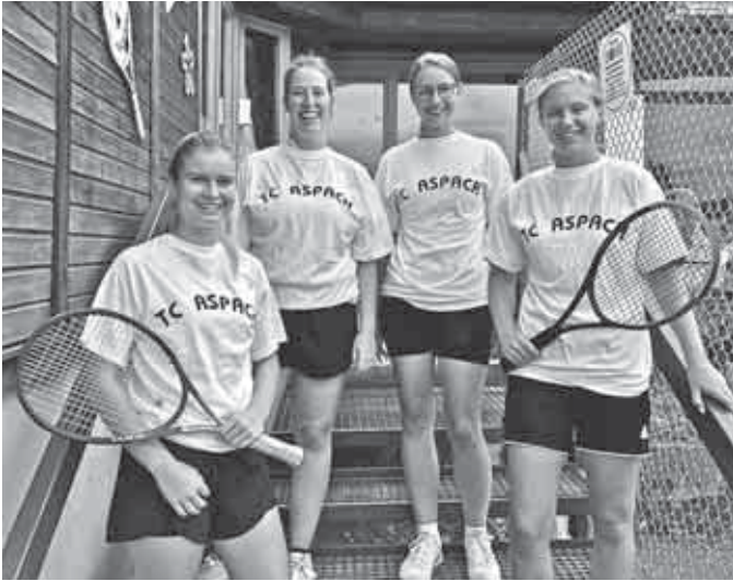
Die Jungen TCA-Damen beim Freundschaftsspiel in Winnenden