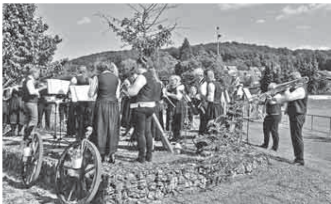
Geburtstagsständchen für den TSV Bad Rietenau: Alles Gute zum Hundertsten.

Musikverein Großaspach e.V. www.musikverein-grossaspach.de