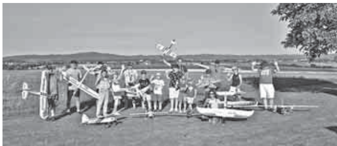
Die Jugendgruppe sagt DANKE!

Das Ziel: Mit der Förderung den Modellnachwuchs zukunftsorientiert fördern – und an den Punkten ansetzen, die für Eltern, Vereine und andere Träger häufig die größten Schwierigkeiten darstellen. Für uns bedeutet das, dass wir Rabatte und Spenden und anderweitige Unterstützung erhalten, die den Einstieg in unser tolles Hobby erleichtert.