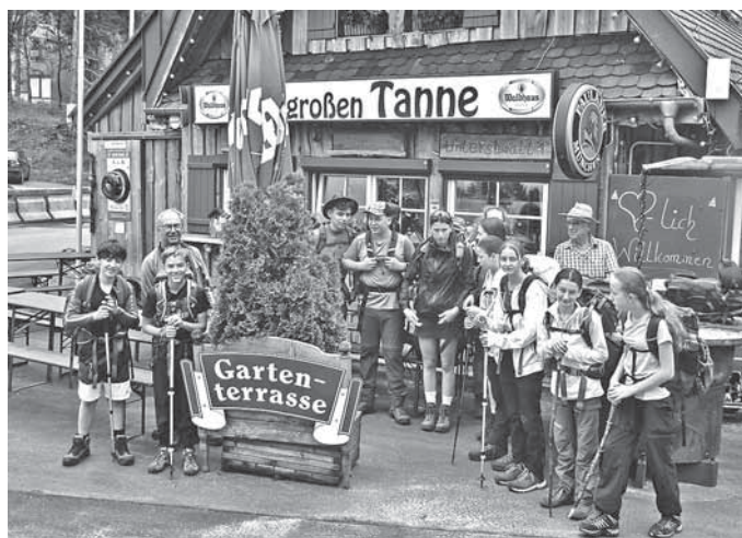
Die fünfte und letzte Etappe führte die Wanderer nach Hausach. Ein kleiner Umweg zu den beeindruckenden Aussichtstühlen