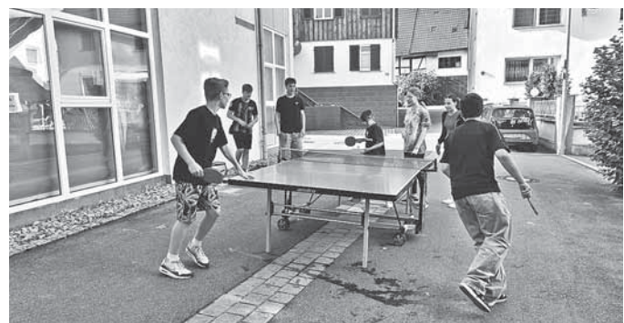
Come as you are Schulschluss

Gute Nachricht der 1. Brief von Petrus Kapitel 5, Vers 5b