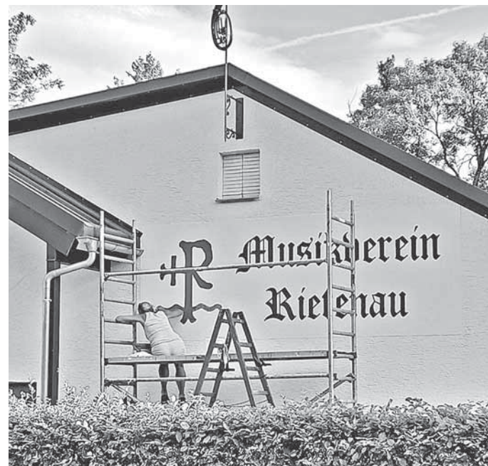
Neue Farbe für die Musikhalle

Fleißige Helfer haben die Sommerpause genutzt, um die Renovierung der Musikhalle weiter voranzubringen. Schon beim ersten Blick ist es zu sehen: Die Musikhalle hat einen frischen Anstrich bekommen! Außerdem wurden Fenster lasiert und auch der Parkettboden im Saal wurde einer Schönheitskur unterzogen. Herzlichen Dank allen für die großartige Unterstützung!