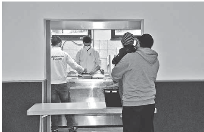
„Ebbes guads“ für Zuhause konnte am vergangenen Sonntag beim Musikverein Rietenau abgeholt werden.