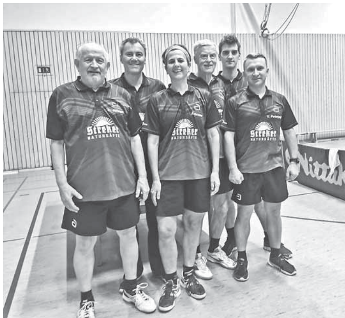
Mannschaftsbild Herren V

Unsere Herren V hatten ebenfalls ein Auswärtsspiel, bei der 7. Mannschaft von Hegnach.